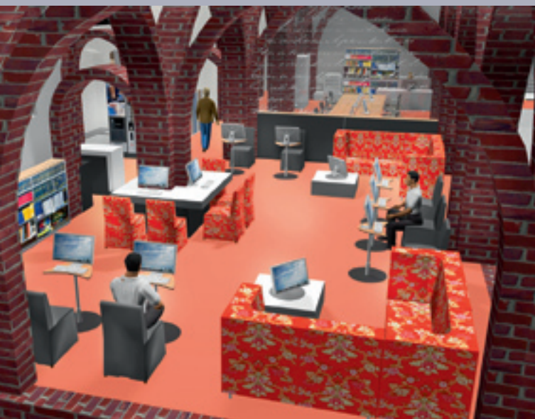
Impressie van het nieuwe Drents Archief. In de digilounge kunnen bezoekers informatie zoeken over het Drentse verleden, programma's spelen en routes samenstellen.